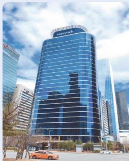
서울핀테크랩 건물 외관