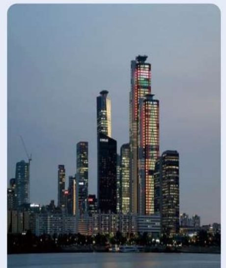
금융중심지 여의도에 입주한 서울핀테크랩